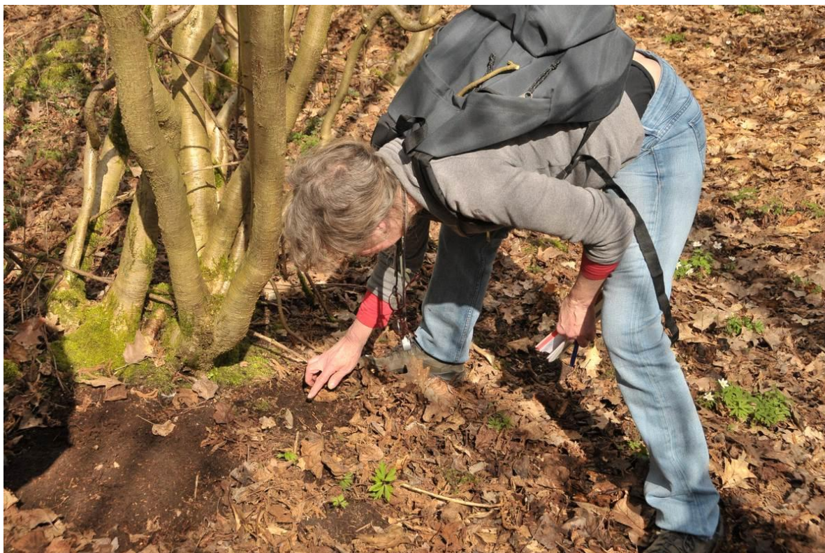
Ine op truffeljacht