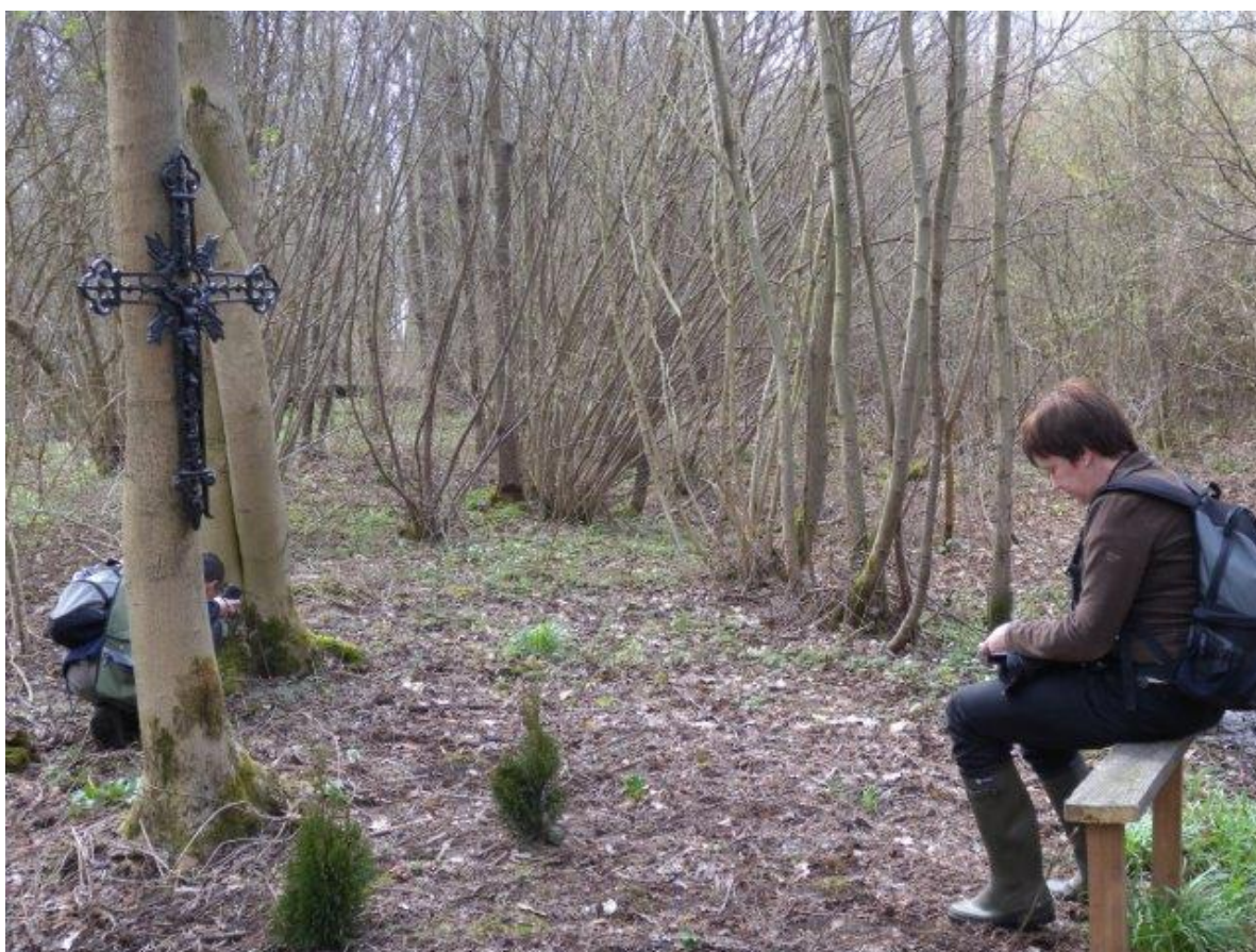
Slobkous in gebed verzonken?